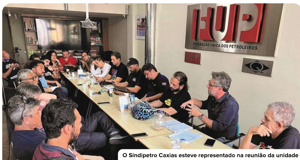
O Sindipetro Caxias esteve representado na reunião da unidade

Além disso, haverá outra reunião, no dia 2, para definição dos próximos passos da negociação pela unidade, incluindo aí as regras para o funcionamento de uma possível mesa única.