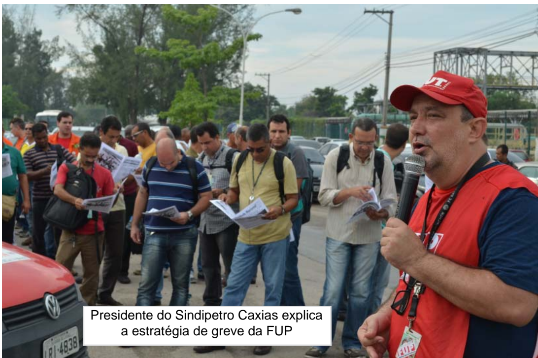
Presidente do Sindipetro Caxias explica a estratégia de greve da FUP

O Conselho Deliberativo da FUP esgotou mais etapa no processo de negociação: avisou ao governo Dilma, que é o acionista majoritário da Petrobrás, da necessidade de mudar o Plano de Gestão e Negócio. O governo sabe que os petroleiros são contra a venda