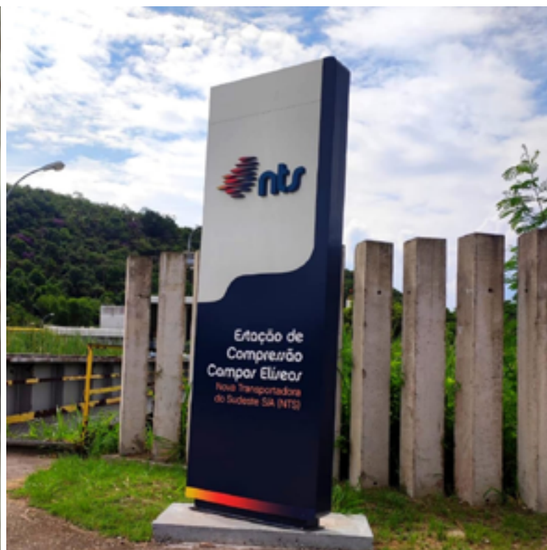
Na foto a Sede da NTS Estação de Compressão Campos Elíseos. As assembleias da unidade até agora foram realizadas virtualmente