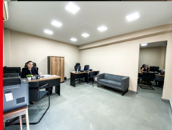
Nova sala do jurídico, de aposentados e do serviço social para atendimento do associado no Sindicato